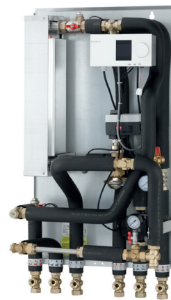
VX Solo 22 med ECL 310 - automatik 1 kreds

En hensigtsmæssig rørføring og konsekvent samling med omløbere gør det nemt at servicere og montere unitten. Montage er hurtig og enkel. Unitten fastgøres på væg og da alle rør er placeret i rørbærafstand fra væg, er det muligt at etablere en pæn rørføring.