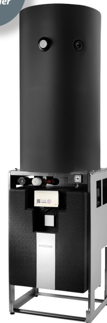
Gulvstillet Comfort A GVXe