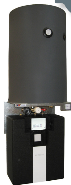
Væghængt Comfort A VVXe